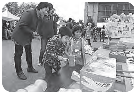
ワニだー バン！バン！バン！