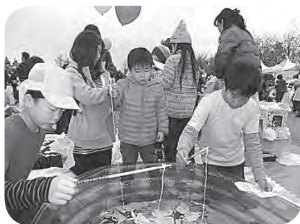
折り紙の魚 沢山釣れたね！