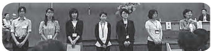
*愛育会を支える保健師さんたち*

大利根愛育会ホームページ http://aiiku-ootone.jimdo.com