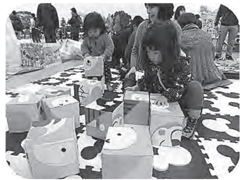
手づくりのブロックあそび。アンパンマンかな？