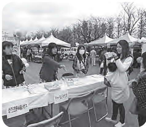
幼児視野体験メガネ こんなに狭いんだ！