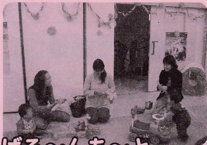
ぼる〜んあ〜と ブードルができたかな？