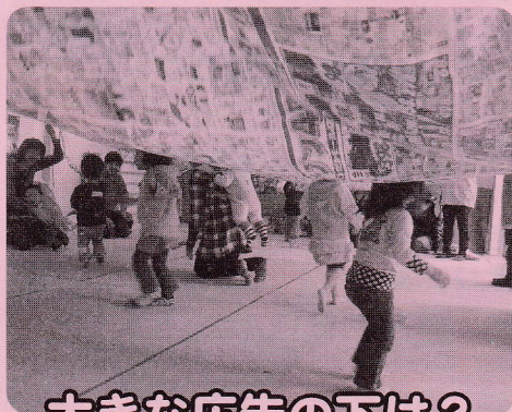
大きな広告の下は？

「はいはい・よちよち・とっこ運動会」は親御さんも必死です。泣き出してしまうお子さんもいました。「ぼる〜んあ〜と」は風船をねじるたびにあちこちでバーンと破裂してしまいましたが、かわいいワンちゃんができあがりました。