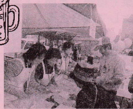
『アルコール パッチテスト』