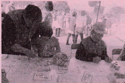
『脳トレ』 あなたの脳は何歳？