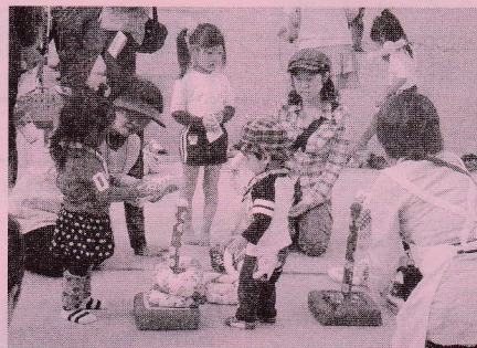
<手作りの輪投げ>東地区担当 材料：タオル・綿・スポンジ・布