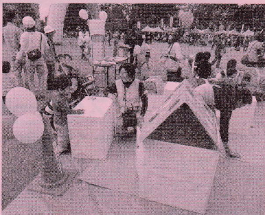
<3Dお絵かき>原道地区担当 材料：段ボール・白い紙・のり