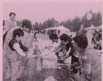
<ワコたたき>豊野地区担当 材料：ペットボトル・ビニールテープ・段ボール