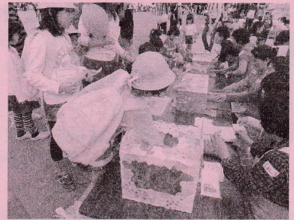
♡ごほうびはお菓子のつかみ取り♡ 「いっぱい取れるといいなあ」