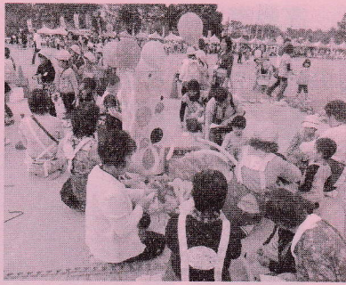
<バルーンアート>元和地区担当 材料：風船・空気入れ