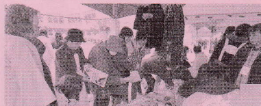
〈バザー〉掘り出し物は?