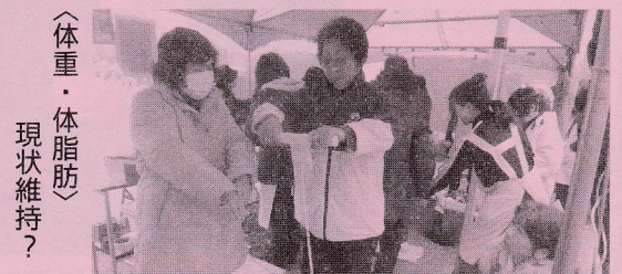
〈体重・体脂肪〉 現状維持?