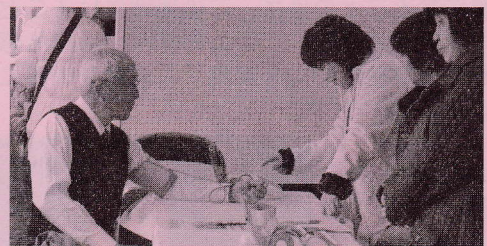
〈血圧測定〉 正常でよかったなあ