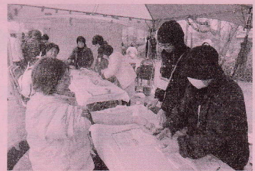
〈アルコールパッチテスト〉