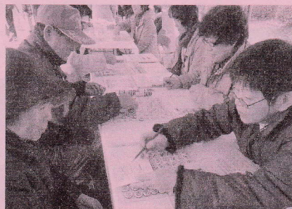
〈脳トレ〉 あなたの脳は何歳かなあ よーいドン! 一番はだれでしょう